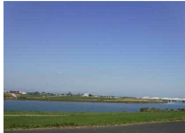
合川緑地からの眺望